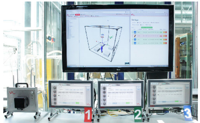
Bild 1. Hardware-in-the-Loop-Simulationsaufbau mit drei Flugsteuerungen (1–3), VAL-Edge-Cloud-Server (links) und VAL-3D-WebStudio (oben).

Durch die digitale Transformation im Kontext Industrie 4.0 gehen bereits während des Engineeringprozesses kinematisierte Geometriemodelle (CAD-basierte Kinematikmodelle) der einzelnen Maschinen für die virtuelle Inbetriebnahme der Steuerungssysteme hervor. Diese Modelle in Kombination mit einer Anbindung an Realdaten (Steuerungssollwerte und/oder Sensoristwerte) liefern die Grundlage zur Erstellung eines digitalen Zwillings der wandlungsfähigen Fabrik. Der digitale Zwilling fügt die Simulationsmodelle der einzelnen Maschinen und Anlagen zur Gesamtszene zusammen.