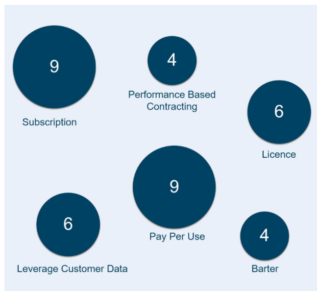
Bild 1. Übersicht von präferierten Geschäftsmodellen. Grafik: Fraunhofer IPA

weitere Definition aus dem Bereich der IT beschreibt das Betreibermodell als ein „Konstrukt, bei dem ein Dienstleister im Auftrag seines Kunden die Verantwortung für den Betrieb einer Anlage übernimmt“ [12]. Abgeleitet für die Kollaboration von verschiedenen Akteuren auf einer Plattform können sich daraus verschiedene Aufgaben an einen Plattformbetreiber ergeben. Dazu zählen die Betreuung des alltäglichen Betriebs der Plattform, dessen Weiterentwicklung, Supportleistungen sowie Marketingaktivitäten und Vertragsgestaltungen [13].