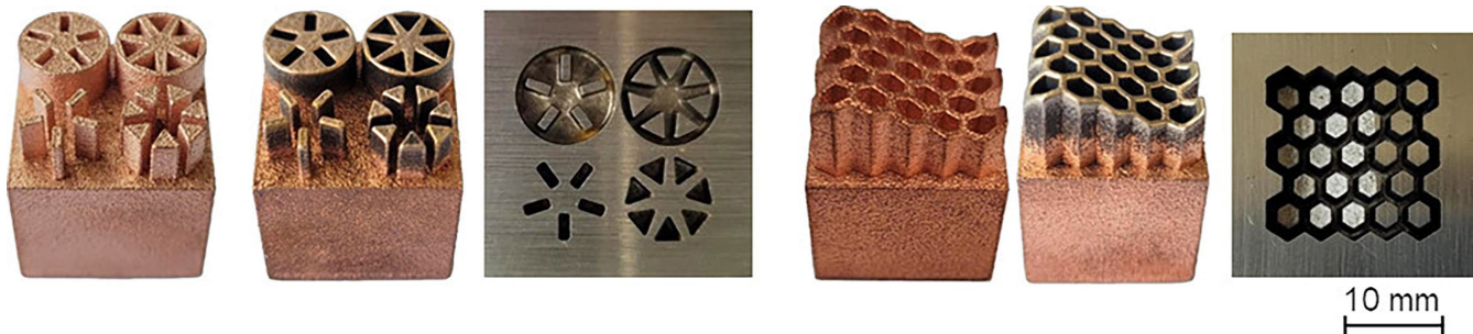
Bild 1. Unterschiedliche, additiv gefertigte Geometrien aus Kupfer vor und nach dem funkenerosiven Senkprozess und die entsprechenden Einsenkungen in Werkzeugstahl. Grafik: eigene Darstellung